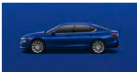
Modrá Energy, uni