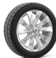
Mintaka 17" strieborné