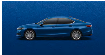
Modrá Cobalt, metalická