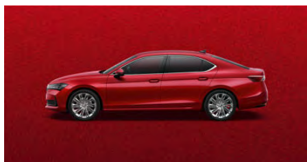
Červená Carmine, metalická