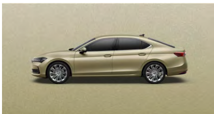
Žltá Ice Tea, metalická