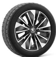
Alkaris 17" čierne leštené