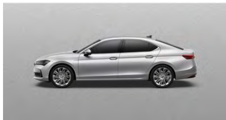
Strieborná Pebble, metalická