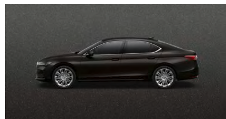
Čierna Ebony, metalická