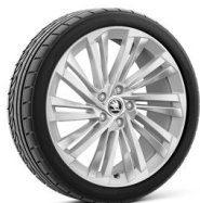
Veritate 19" strieborné