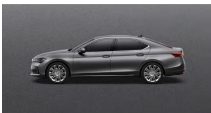
Šivá Graphite, metalická