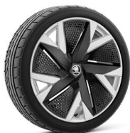
Aniara 19" strieborné s aero krytmí