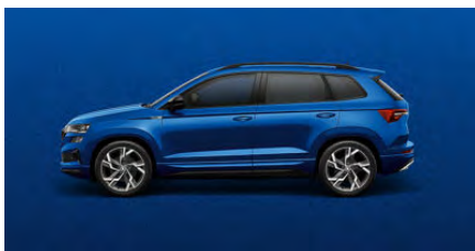
Modrá Race, metalická