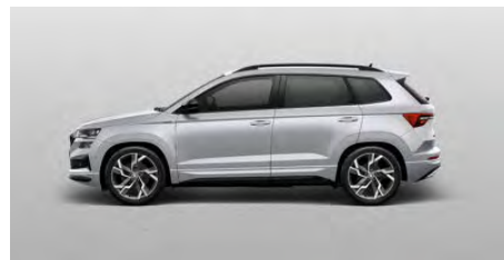
Strieborná Brilliant, metalická