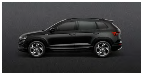
Čierna Magic, metalická