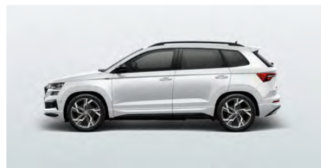
Biela Moon, metalická