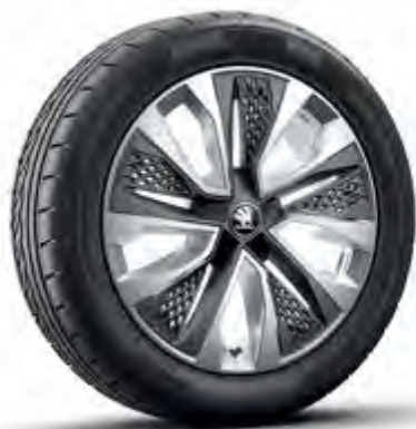
Procyon 18" s aero krytmi čierne matné