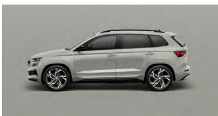
Sivá Steel, uni