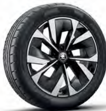
Sagitarus 19" antracitové