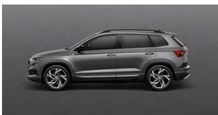
Sivá Graphite, metalická