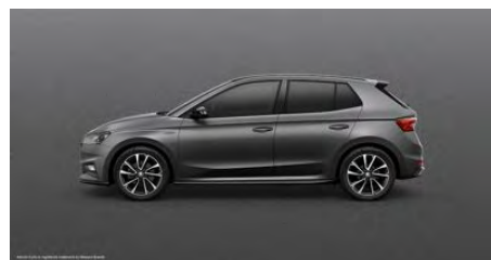
Sivá Graphite, metalická