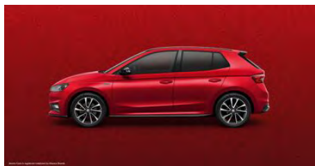
Červená Velvet, metalická