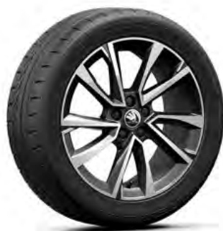
Procyon 17" čierne lesklé