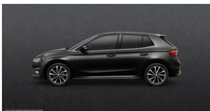
Čierna Magic, metalická