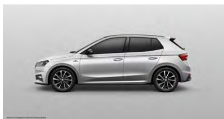
Strieborná Brilliant, metalická