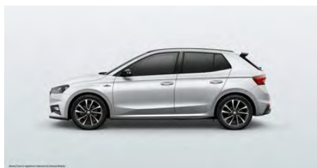
Biela Moon, metalická