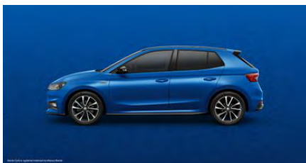
Modrá Race, metalická