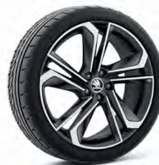
Libra 18" čierne lesklé