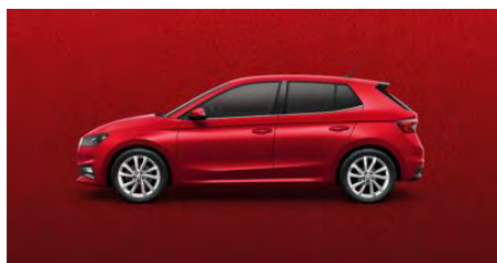
Červená Velvet, metalická