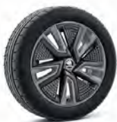
Proxima 16" sivé s aero krytmi