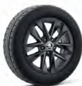
Rotare 15" čierne