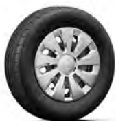
Oceľové disky 15" s krytmi Callisto