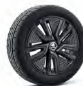
Proxima 16" čierne lesklé s aero krytmi