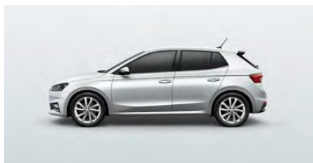
Biela Moon, metalická