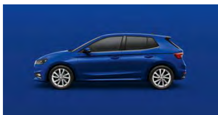
Modrá Energy, uni