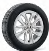
Rotare 15" strieborné