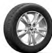
Proxima 16" strieborné