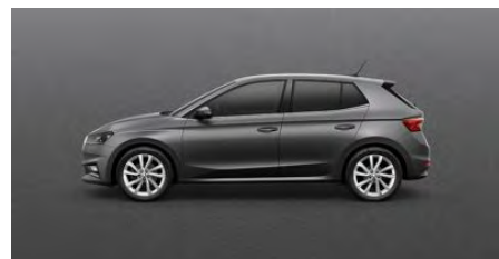
Sivá Graphite, metalická