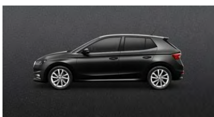
Čierna Magic, metalická