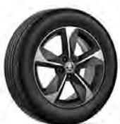
Ursus 16" čierne