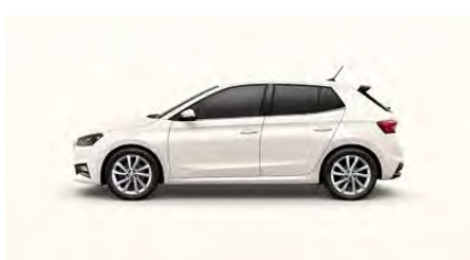
Biela Candy, uni