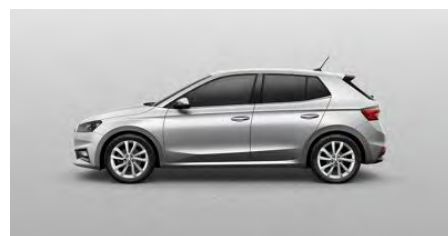
Strieborná Brilliant, metalická