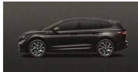
Čierna Magic, metalická