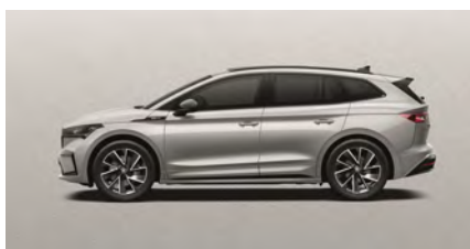
Strieborná Brilliant, metalická