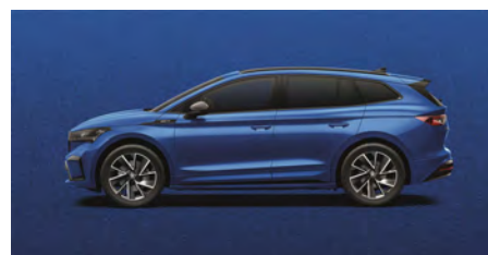
Modrá Race, metalická