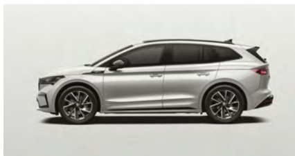
Biela Moon, metalická