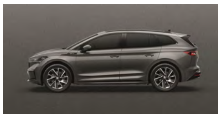
Sivá Graphite, metalická