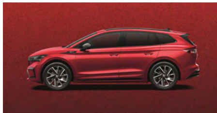
Červená Velvet, metalická