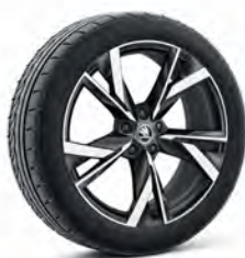
Taurus 20" antracitové