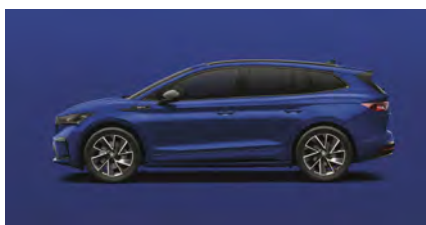
Modrá Energy, uni