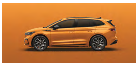
Oranžová Phoenix, metalická