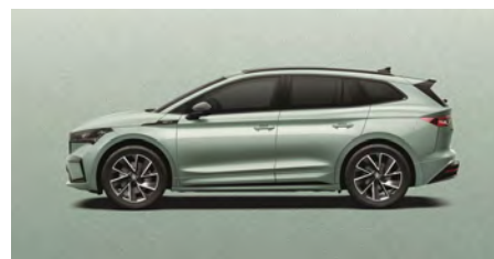
Strieborná Arctic, metalická