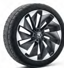
Supernova 21" strieborné leštené