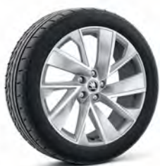
Vega 20" strieborné leštené