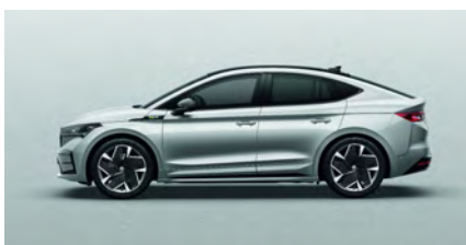
Strieborná Brilliant, metalická