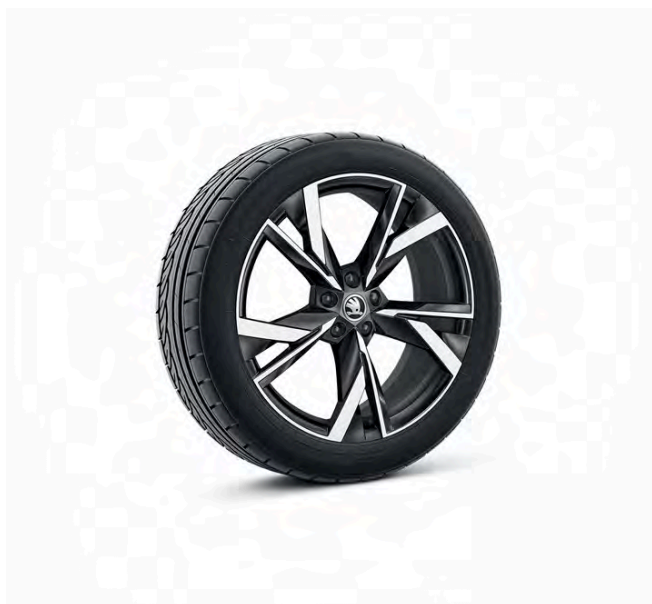
Taurus 20" antracitové