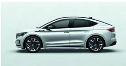
Biela Moon, metalická