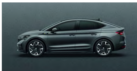
Šivá Graphite, metalická