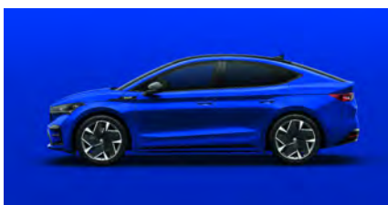
Modrá Energy, uni