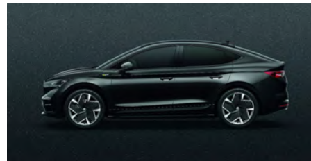
Čierna Magic, metalická