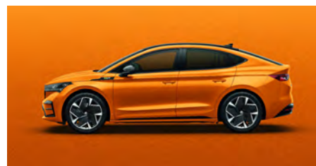
Oranžová Phoenix, metalická