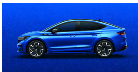
Modrá Race, metalická