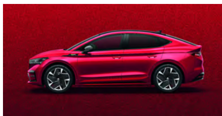
Červená Velvet, metalická