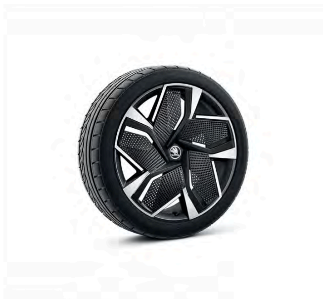
Vision 21" antracitové leštené