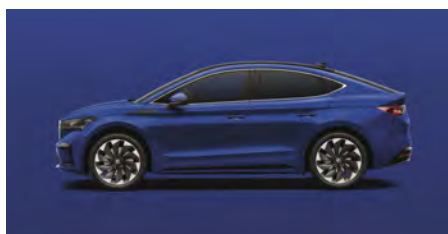
Modrá Energy, uni