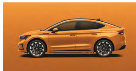
Oranžová Phoenix, metalická