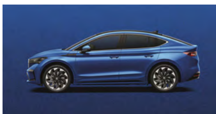
Modrá Race, metalická