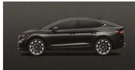
Čierna Magic, metalická