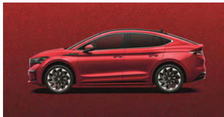
Červená Velvet, metalická