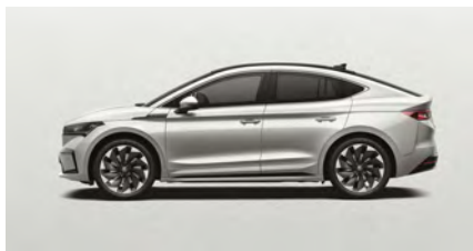
Biela Moon, metalická