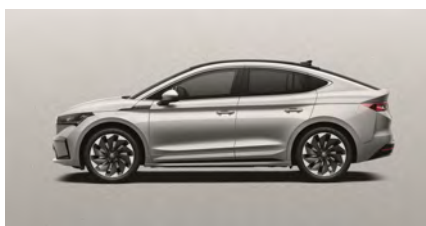
Strieborná Brilliant, metalická