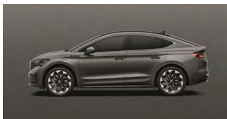
Sivá Graphite, metalická