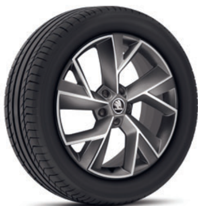
19" disky TRIGLAV z ľahkej zliatiny základná výbava

Všetky motory na splnenie limitov emisného predpisu EU6AG využívajú filter pevných častíc na zachytávanie a redukciu nespálených častíc.