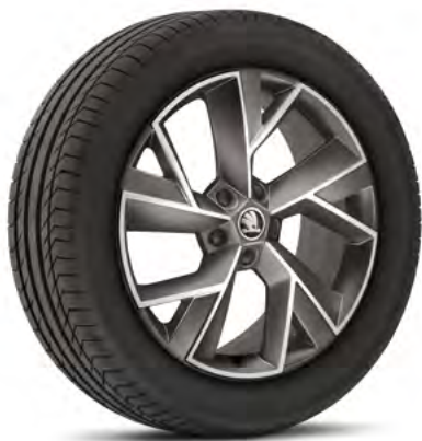
19" disky TRIGLAV z ľahkej zliatiny základná výbava

Všetky motory na splnenie limitov emisného predpisu EU6AG využívajú filter pevných častíc na zachytávanie a redukciu nespálených častíc.