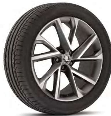
20" disky VEGA z ľahkej zliatiny doplnková výbava