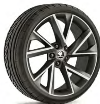
19" disky VEGA z ľahkej zliatiny – antracitové doplnková výbava