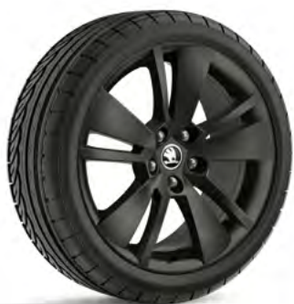
18" disky ZENITH z ľahkej zliatiny – čierne základná výbava

Bližšie informácie nájdete na stránkach www.skoda-auto.sk/Tyre alebo u vášho dílera.