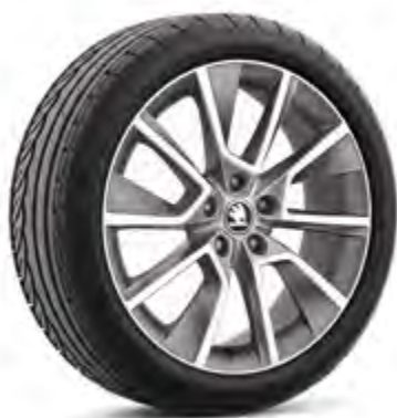
18" disky BRAGA z ľahkej zliatiny antracitové

Bližšie informácie nájdete na stránkach www.skoda-auto.sk /Tyre alebo u vášho dileru.