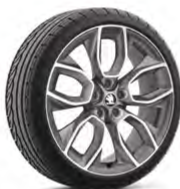
19" disky MANASLU z ľahkej zliatiny antracitové